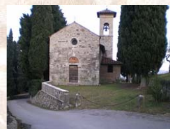
Oratorio San Jacopo (XIII sec.)

Per ulteriori informazioni e prenotazione rivolgersi a: