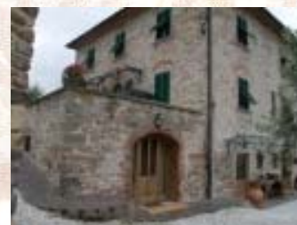
Agriturismo "Il Calesse"

Merenda finale all'agriturismo con prodotti locali: crostini toscani, fettunta, formaggio pecorino e confetture, prosciutto e salame, torta della nonna, acqua e vino ... regolarsi con il pranzo al sacco!